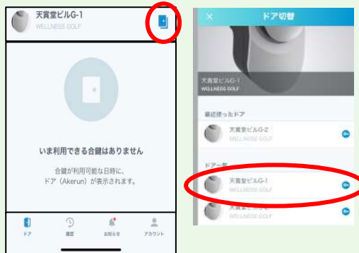
② ご予約いただいたラウンジを選択ください