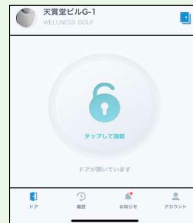
⑥ 選択のドアが開いている状態、ご退室は、④ から操作を行います