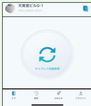
④ 予約時間の5分前から使えます、中心をタップし鍵の状態を確認できます