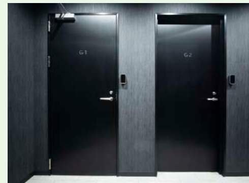
③ 施設のドア前でアプリを起動